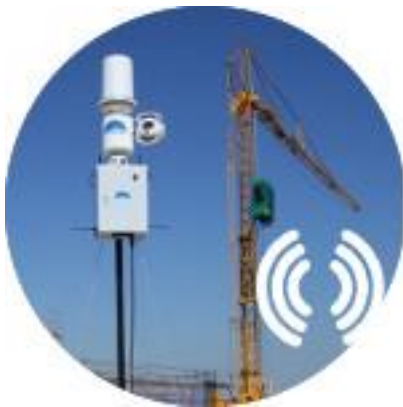
Montage tussen de 2 en 6 meter hoog