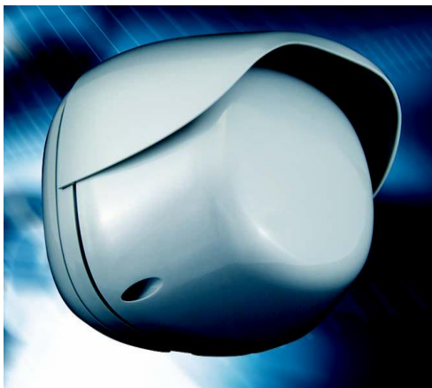
Murena Plus met regenscherm

De Murena is een zogenaamde "doppler" radar (zender en ontvanger in dezelfde behuizing) en daarmee uitermate geschikt voor de bewaking van gevels, balkons, terrassen, daken en ingangen. De Murena is in staat om naast het volume, eveneens de afstand en snelheid van een bewegend object te meten. Deze 3 criteria worden door de digitale signaalanalyse met "Fuzzy logic" geanalyseerd waardoor klantspecifiek doelalarm kan worden bepaald. Hierdoor is de Murena zeer gebruikersvriendelijk en biedt de meest optimale detectie bij minimale onterechte meldingen. De behuizing van polycarbonaat met UV- bescherming maakt de Murena uitstekend geschikt voor buitentoepassing. De optionele RS-kit maakt de bekabeling onzichtbaar en bevat tevens een regenscherm.